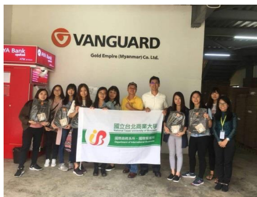
參訪企業—精嘉科技