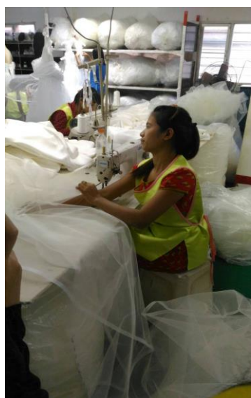
圖(六)員工縫製紗裙

最後參訪的企業為新名企業，同時也是全球第二大的婚紗製造商，諾大的廠房分成眾多部門，設計組、車間、縫紉、釘珠等，會將部門分成如此精細是因為婚紗的製作不容易，精緻的婚紗是無法藉由機器來完成，每項過程皆是需要大量的人力才能製作，光是婚紗外層美麗的紗面和蕾絲想要做出完美的蓬度，皆是員工一層一層將其車在一起，才能有這麼美麗的外層；而婚紗最外層的貼鑽或者珠，並不是隨意貼上，一針一線的將每顆微小的珠子串在一起並且縫製在紗上面才是最複雜的，這項工作考驗員工集高的細心和耐心才能縫紉出最精美的花樣。