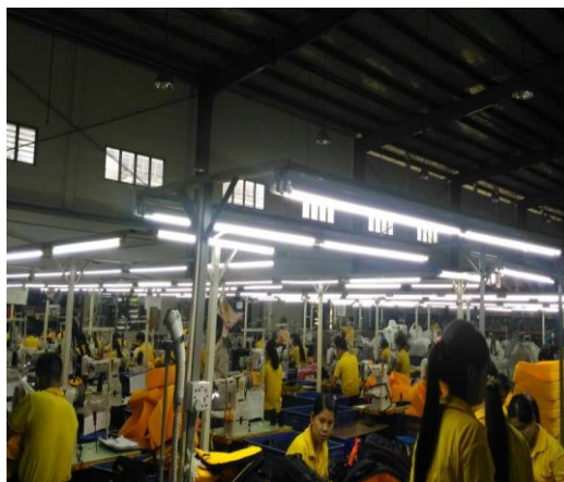
圖(四)攝影背包生產線

帶領我們參觀的羅協理是台灣人，經驗豐富的他過去曾在鴻海擔任主管，因此對於生產管理的方式相當有一套，他提及由於緬甸的生產效率無法像其他國家那麼高，因此教導員工0和1的觀念，也就是所謂錯誤和正確，當員工做錯時他會用心指導，員工可以快速理解錯誤點並馬上修正，專注於做正確的事，便可降的生產過程中的不良率。此外更採取部門獎勵機制，透過部門之間的績效來給予更多的鼓勵，讓員工可以從工作中獲得更高的成就感，因而提升公司的產量和品質。