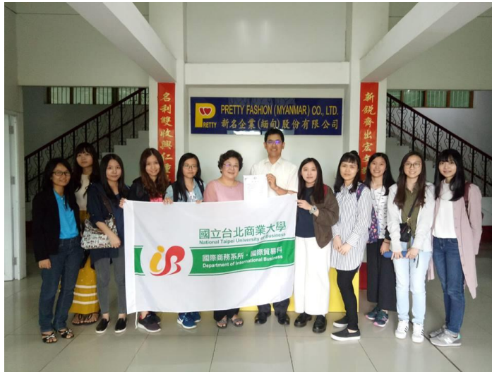
圖(八)參訪新名企業

可以在布料上做記號且過了一段時間會自動揮發的記號筆，在布料上面做上記號後，員工可以清楚了解到縫紉的部位，錯誤率也會隨之下降。企業在緬甸發展常常會面臨一些細微的問題，但是企業都會相當用心想出解決之道，不但使員工在操作方面可以得心應手，更重要的是能為企業創造更高的產量。