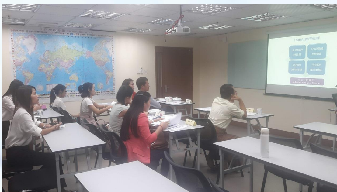
協助北商 EMBA 說明會